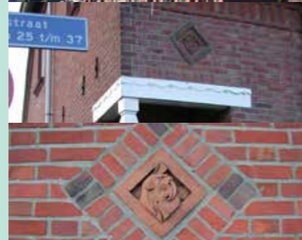
Verschillende schaalniveaus wijk