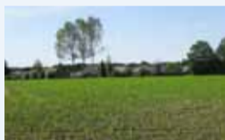
Een aan de rand bebouwde eng