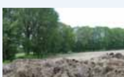
Houtwal langs kamp