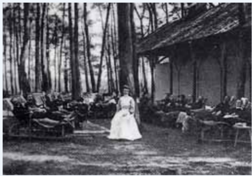
Herstellende tuberculose patiënten