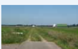
A28 door Arkemheen