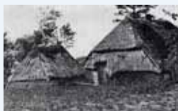
Hutten op het veld