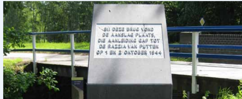
Oldenallerse brug: plek van de aanslag op 30 sept/1 okt 1944.

Psalm 84: 'Welzalig hij die al zijn kracht en hulp alleen van U verwacht, die kiest de welgebaande wegen.'