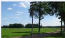
Engersteeg tussen de oude Zuiderzeekust en de Putter eng.