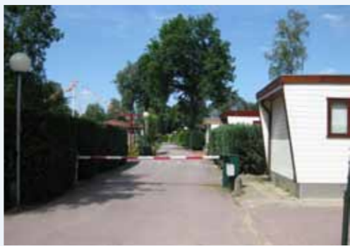
Bungalowpark in Krachtighuizen