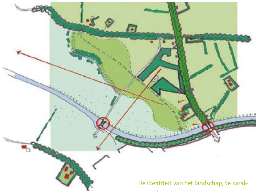
De identiteit van het landschap, de karakteristieke ontwikkelingsgeschiedenis en de ordeningsprincipes van het landschap en de bebouwing levert een 'schatkaart' voor het toekomstige landgoed. (ill. HzA Stedebouw & Landschap)

Gelders Genootschap • Oranjerie Kasteel Zypendaal • Postbus 68, 6800 AB Arnhem T (026) 442 17 42 • F (026) 442 94 04 • www.geldersgenootschap.nl a.kho@geldersgenootschap.nl