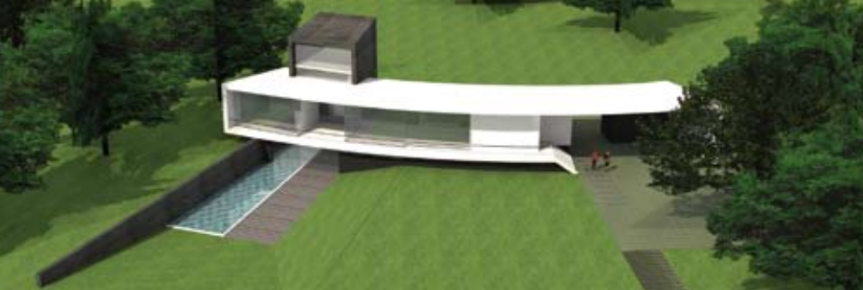
Landhuis De Fliert, hypermodern passend in de weidse omgeving aan een beek. (ill. Bureau Ruimtewerk en MAAS Architecten)